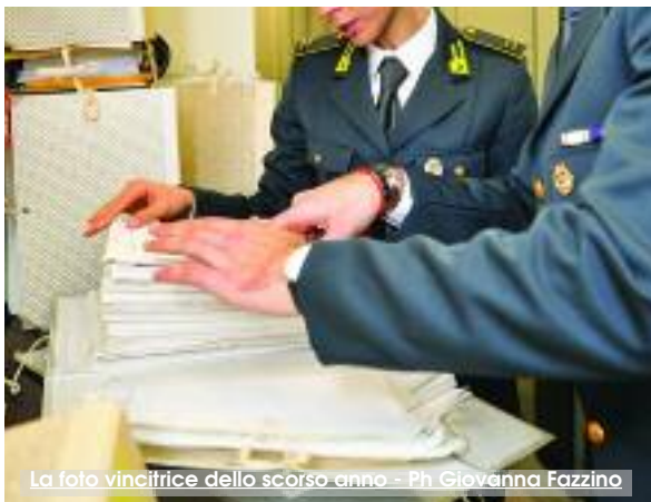
La foto vincitrice dello scorso anno

Sulle carte si dichiarava rivenditore e proprietario di una piccola impresa destinata alla vendita di souvenir in ceramica, nella realtà invece era l'artefice di una strategia commerciale "in nero" che garantiva un giro d'affari da milioni di euro. Questa è la sintesi del sistema, poco convenzionale, messo a punto da un commerciante della Valle del Belice. L'imprenditore, dietro la copertura dei souvenir in ceramica in realtà gestiva un vero e proprio mercato di attrezzature edili, mezzi usati e pezzi di ricambio, che vendeva a prezzi vantaggiosi. Aveva inoltre creato una rete "fantasma" di collaboratori. La manodopera "in nero" era impiegata per procurarsi in tutta la Sicilia i prodotti che sarebbero stati immessi nel mercato. Le indagini, condotte