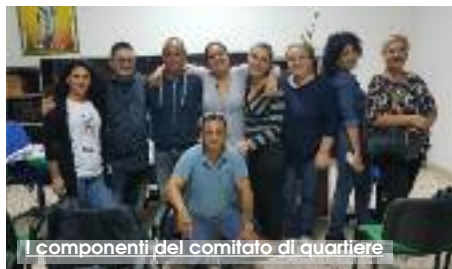
I componenti del comitato di quartiere

Tra gli altri obiettivi: la realizzazione di un orto condiviso, progetto che punta al contrasto alla povertà e al recupero di aree spesso usate come discariche; il portinerio di quartiere; tante attività sportive, tra cui i giochi senza frontiera in piazza che sono in programma in primavera. Nel frattempo il comitato aspira anche a dare una mano al quartiere per far rivivere l'economia di zona con un progetto incentrato sulla realizzazione di un piano di commercio su aree pubbliche nei quartieri popolari con l'obiettivo di contrastare la povertà e l'abusivismo. (G.L)