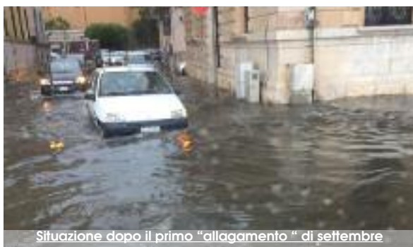
Situazione dopo il primo "allagamento" di settembre

Tant'è che, con le abbondanti piogge di domenica notte, non si sono verificati gli inconvenienti (leggasi allagamenti) delle prime volte: "Il 22 notte siamo usciti alle 04.30 con la macchina della Protezione Civile per andare a verificare la situazione delle varie zone che sono state sottoposte, nelle due